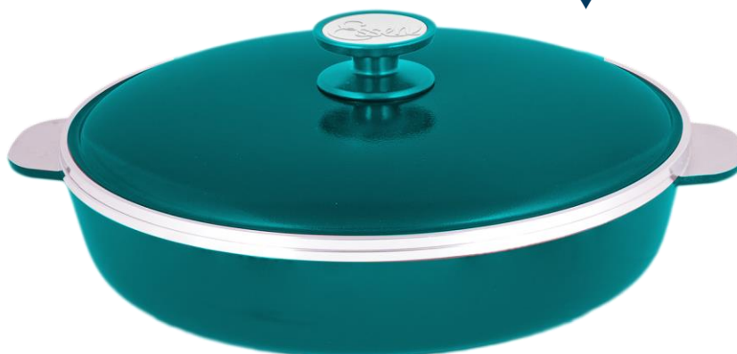
SARTÉN 31CM Cód.: 38653130