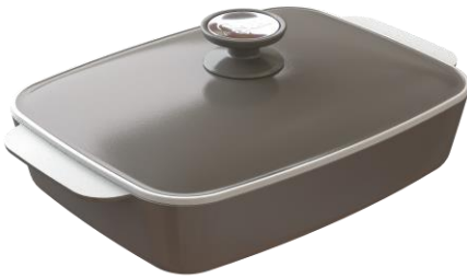
FUENTE RECTANGULAR 30CM

¡Aprovechá la oportunidad para contactar a tus contactos y clientes!