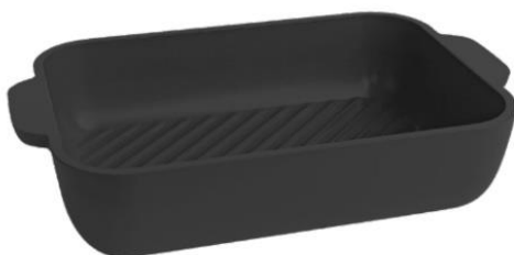
BIFERA EXCLUSIVA 19CM NUIT

Se entregará como premio una BIFERA EXCLUSIVA 19CM NUIT para los ganadores del trimestre de Ciclo 04-2024 a Ciclo 06-2024