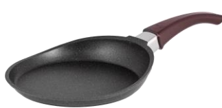
SARTÉN EXPRESS CÓD.: 38222052