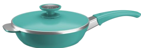
SARTÉN 28CM CÓD.: 38252812

Disponibles a la venta hasta C6/2024 o hasta agotar stock.