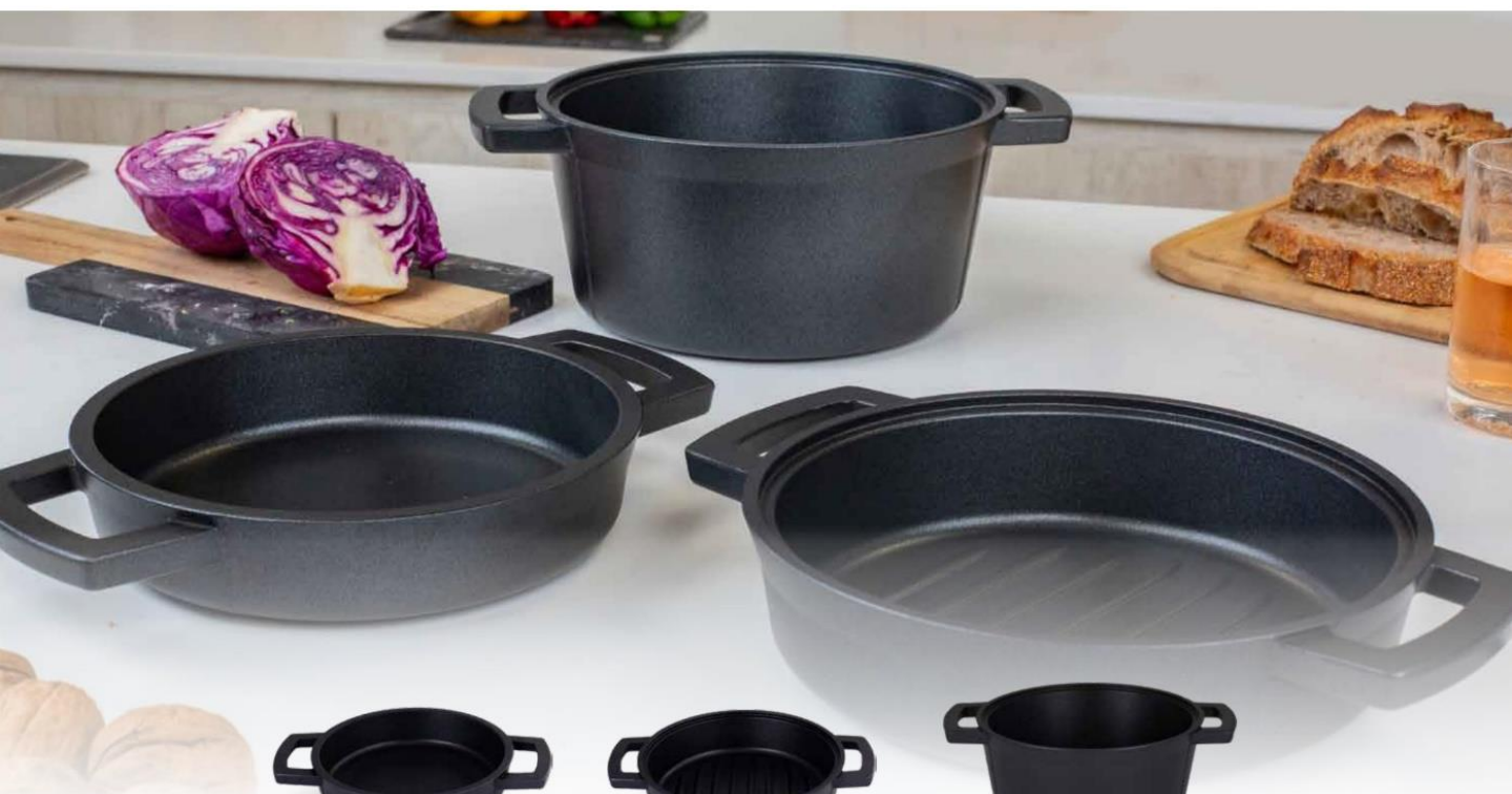
SARTÉN PRESSENTE 18CM Cód.: 83641893

¡Incentivá, motivá y premiá con Colección PRESSENTE!