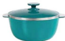
CACEROLA 24CM CAPRI Cód.: 38452430