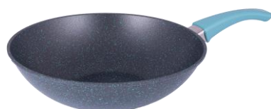
WOK CÓD.: 38223001

A su vez con el objetivo de asegurar un mejor grado de servicio y optimizar el surtido que ofrecemos, te informamos que los siguientes productos con funcionalidades complementarias (JARRO QUICK, WOK Y SARTÉN EXPRESS), vamos a mantenerlos en un único tono neutro en mango, optando por el TERRA, y que sea compatible con las diferentes líneas que tenemos disponibles (CAPRI, CHERRY & TERRA). Por tal motivo, estas referencias, se darán de baja de la línea CHERRY y no se lanzarán junto a la LINEA CAPRI. (Disponibles hasta C5/2024 o hasta agotar stock)