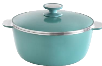
CACEROLA 28CM CÓD.: 38452812