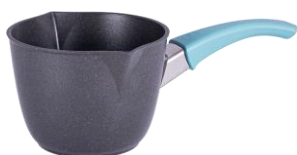
JARRO QUICK CÓD.: 38121715

Disponibles a la venta hasta C5/2024 o hasta agotar stock.