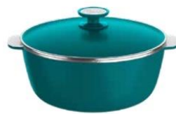
CACEROLA 28CM CAPRI Cód.: 38452830