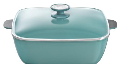
CACEROLA CUADRADA 29CM CÓD.: 38752912