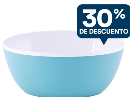
BOWL MEDIANO AQUA Cód.: 60050135

PSVP Lista: $1.504 PSVP Negocio: $1.343 Puntos Negocio: 14 PUNTOS EXTRA: 5