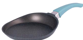
SARTÉN EXPRESS CÓD.: 38222001