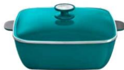
CUADRADA 29CM CAPRI Cód.: 38752930