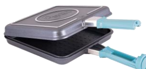
FLIP 2.1 CÓD.: 38122817

Disponibles a la venta hasta C5/2024 o hasta agotar stock.