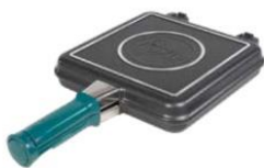
FLIP 2.1 CAPRI Cód.: 38122830