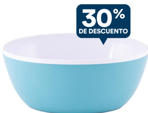
BOWL GRANDE AQUA Cód.: 60050136

Te compartimos promos increíbles de Bazar Premium que no podés perderte este ciclo 4.