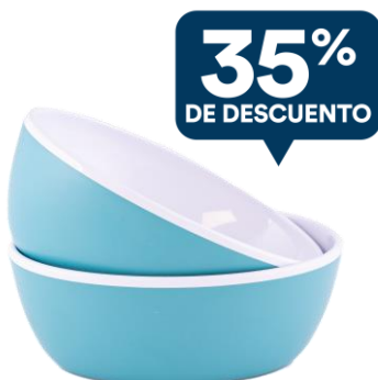
CUENCO OVAL AQUA SET X2 Cód.: 60050137

PSVP Lista: $1.293 PSVP Negocio: $1.154 Puntos Negocio: 12 PUNTOS EXTRA: 5