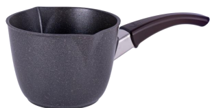
JARRO QUICK CÓD.: 38121752

A su vez con el objetivo de asegurar un mejor grado de servicio y optimizar el surtido que ofrecemos, te informamos que los siguientes productos con funcionalidades complementarias (JARRO QUICK, WOK Y SARTÉN EXPRESS), vamos a mantenerlos en un único tono neutro en mango, optando por el TERRA, y que sea compatible con las diferentes líneas que tenemos disponibles (CAPRI, CHERRY & TERRA). Por tal motivo, estas referencias, se darán de baja de la línea CHERRY y no se lanzarán junto a la LINEA CAPRI. (Disponibles hasta C5/2024 o hasta agotar stock)