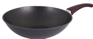
WOK CÓD.: 38223052

Disponibles a la venta hasta C6/2024 o hasta agotar stock.